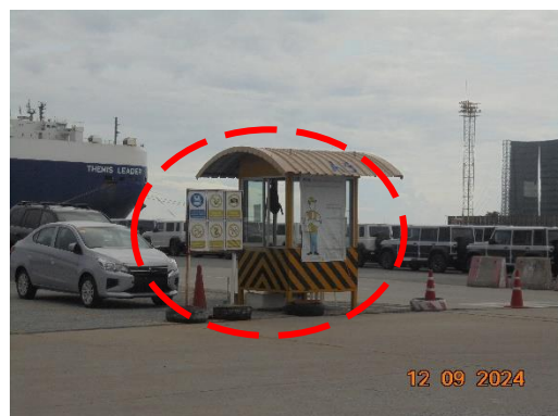
รูปที่ 14 ป้ายเตือนความปลอดภัย