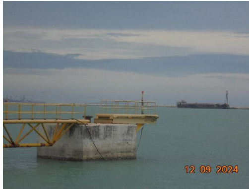
รูปที่ 11 การติดตั้งสัญญาณการเดินเรือ