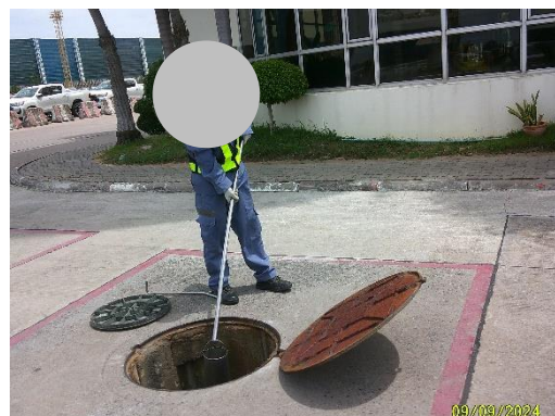
รูปที่ 13 การตรวจวัดคุณภาพน้ำ