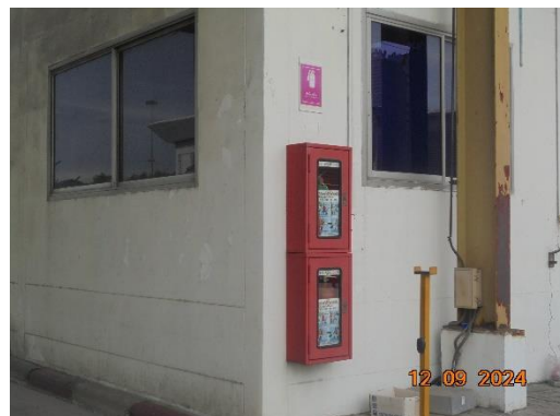
รูปที่ 15 อุปกรณ์ป้องกันและระงับอัคคีภัย